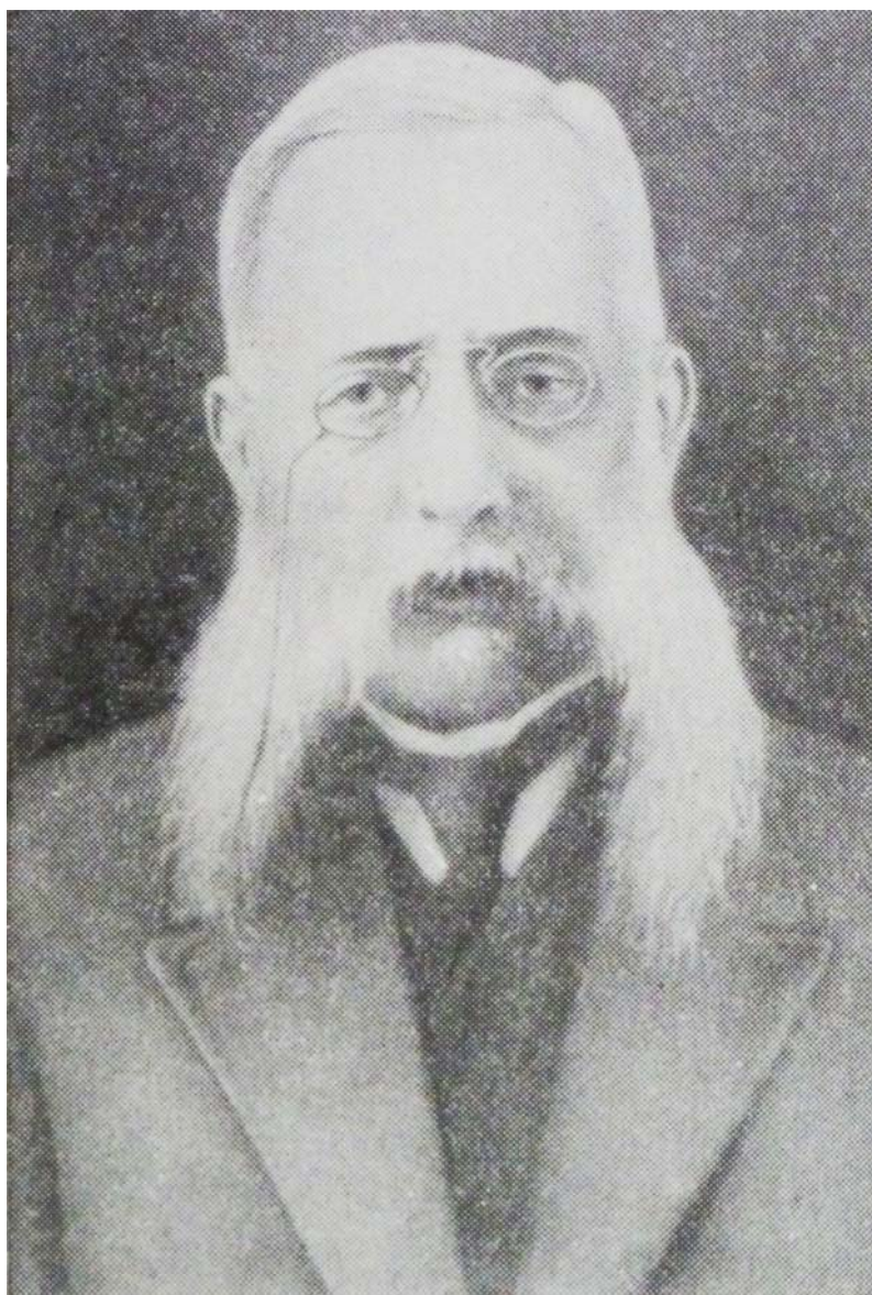
Чеслав Иванович Хенцинский [11]