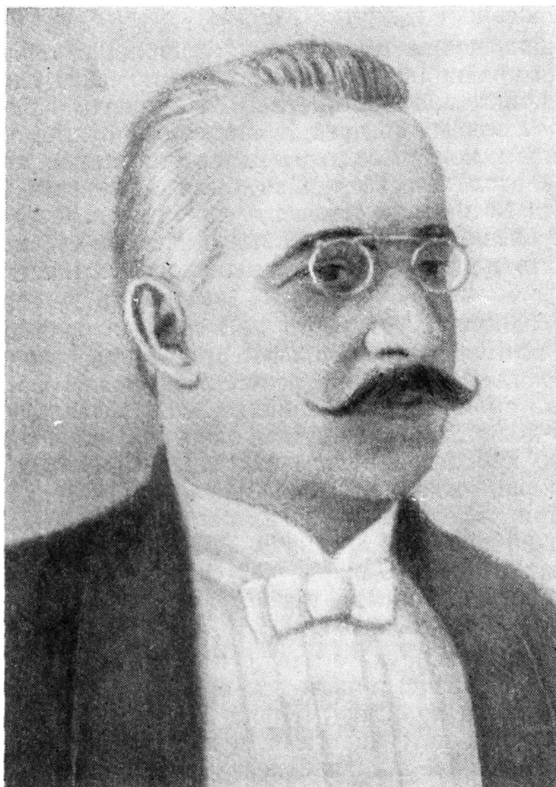
Дмитрий Леонидович Романовский [13]